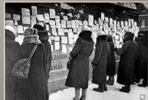
8 дне блокады Ленинграда. Обучающиеся обмениваются карточками. 1942