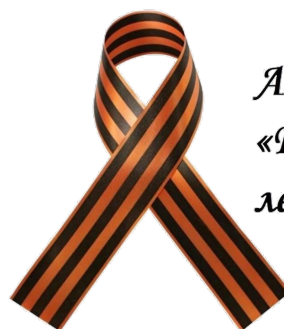
Акция «Георгиевская ленточка»